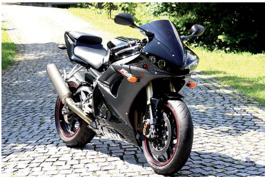
Moto. Transportes privados particulares