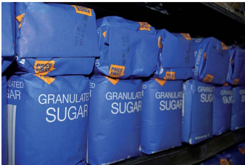
Mercancías que pueden ser transportadas