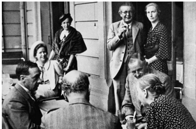
Valentine et Jean Piaget en 1932

La terminología que Decroly le da a este método, centros de interés, se basa en la globalización de las diferentes áreas del curriculum, desde primaria a bachillerato, que estén centradas en un tema de interés para el grupo de alumnos.