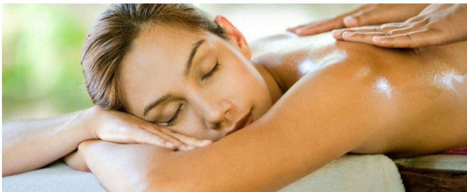
Aplicación de aceites hidratantes corporales

Cuando se utilicen aparatos vibradores como sustituto del masaje manual, se deberá tener en cuenta la sensibilidad de la persona que se está tratando, evitando su aplicación en las zonas donde el tejido muscular y adiposo es escaso (tobillos, articulaciones...), en inflamaciones agudas, trombosis, fracturas, heridas y lesiones de la piel.