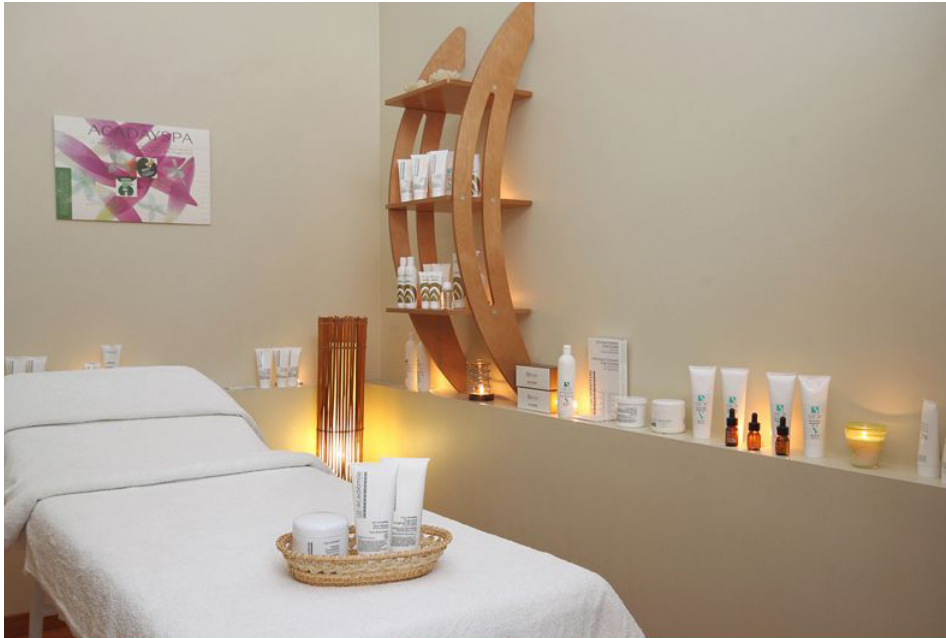
Cabina estética en perfecto orden y armonía

Para recibir al cliente, ante todo, la cabina de tratamiento debe estar limpia y desinfectada. En perfecto orden para evitar cualquier tropiezo o resbalón que pueda dar lugar a cualquier accidente. Este proceso se debe realizar antes de la recepción de cada cliente, así como la esterilización o desinfección de los equipos utilizados, para garantizar el control de los factores de riesgo físicos, químicos y biológicos.