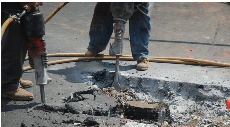
Factor de riesgo relacionado con el ruido.